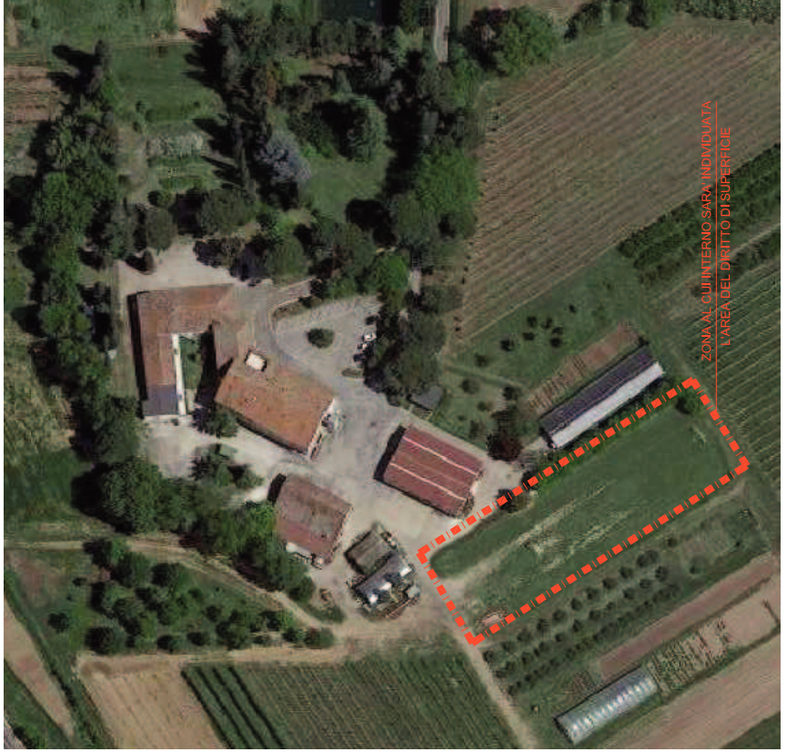
ZONA AL CUI INTERNO SARA' INDIVIDUATA L'AREA DEL DIRITTO DI SUPERFICIE