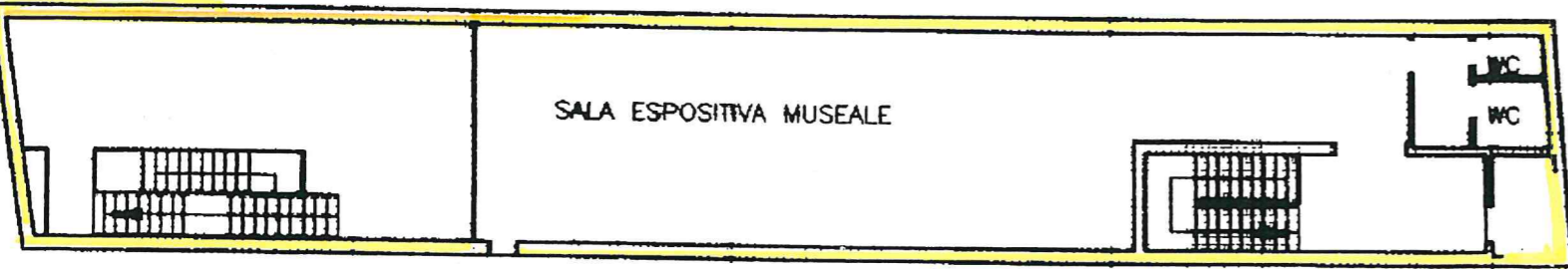
TERZO PIANO H=2.70