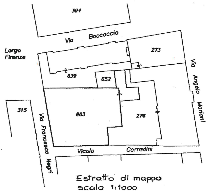
Estratto di mappa scala 1:1000